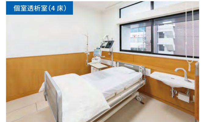
個室での透析も可能です。(個室料金1,100円/日)

オーバーナイト透析対応施設は少なく、当院は江坂駅から徒歩8分の距離にあるため北摂だけでなく広域から透析に通院されています。