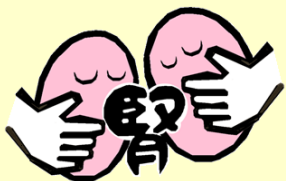
「じんまもるシール」

腎臓のはたらきが低下すると、薬が体から排出されにくくなるお薬や腎臓に影響を与えるお薬もあるため特に注意が必要です。「じんまもるシール」お薬手帳に貼り、採血データを確認してもらうことで腎臓の状態を他医療機関や調剤薬局にお知らせすることができます。シールをご希望の場合、受診時に主治医へお気軽にお声掛けください。